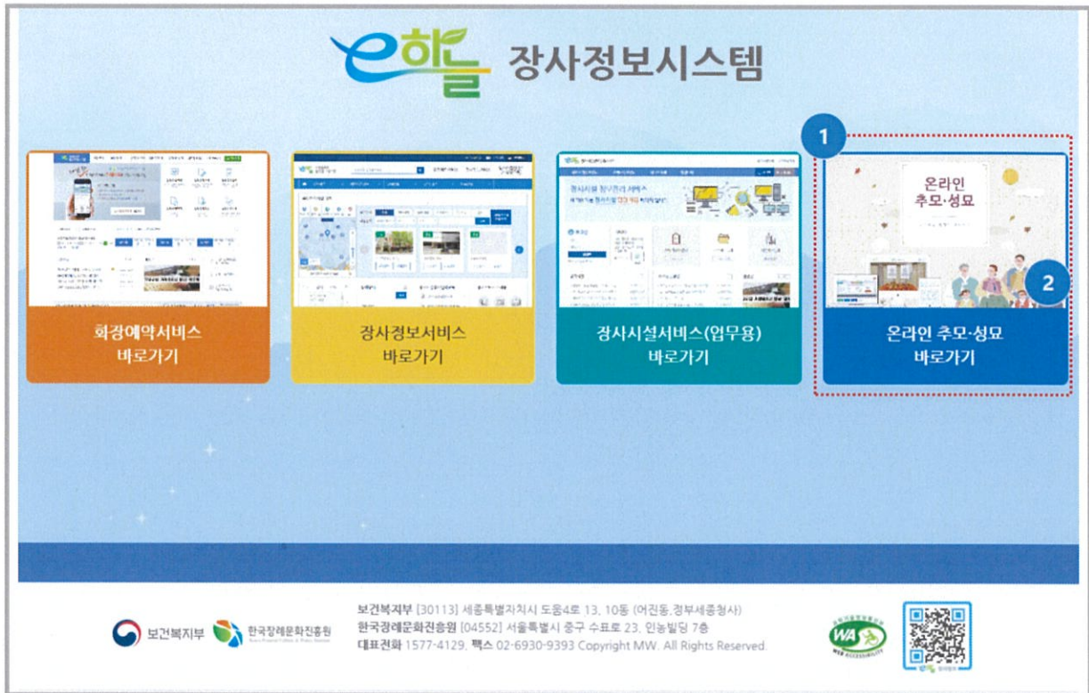
<e하늘 포털 메인화면>